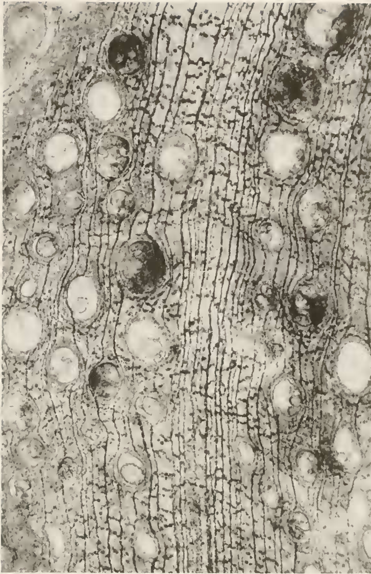
Abb. 1. Bombacoxylon cf. oweni . Querschliff im Bereich einer Grenzzone von kleinen zu größeren Gefäßen, \times 40 .

Fasern des Grundgewebes im Querschnitt überwiegend polygonal, quadratisch, häufig nur 1–2 Reihen zwischen zwei Holzstrahlen, seltener bis 11 Reihen, etwa 9 Faserreihen auf 100 \mu\text{m} tangentialer Erstreckung, Durchmesser der Fasern 10–16 \mu\text{m} , Wände mit zahlreichen rundlichen Tüpfeln, 5–7 \mu\text{m} .